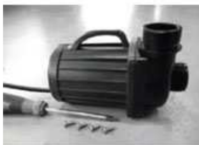
odmontujte šroub z krytu rotoru