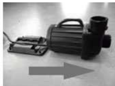
vysuňte čerpadlo z podstavce