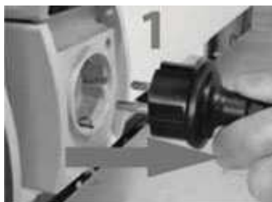
odpojte čerpadlo od zdroje