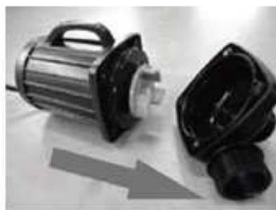
sundejte kryt rotoru