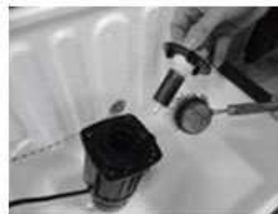
očistěte rotor a motor pomocí kartáče