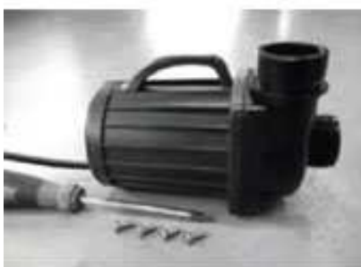
odmontujte šroub z krytu rotoru