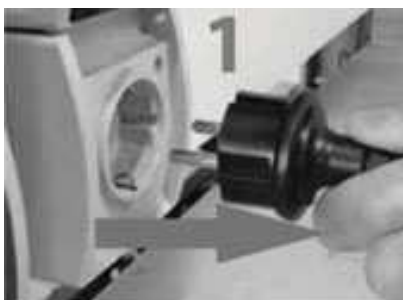
odpojte čerpadlo od zdroje